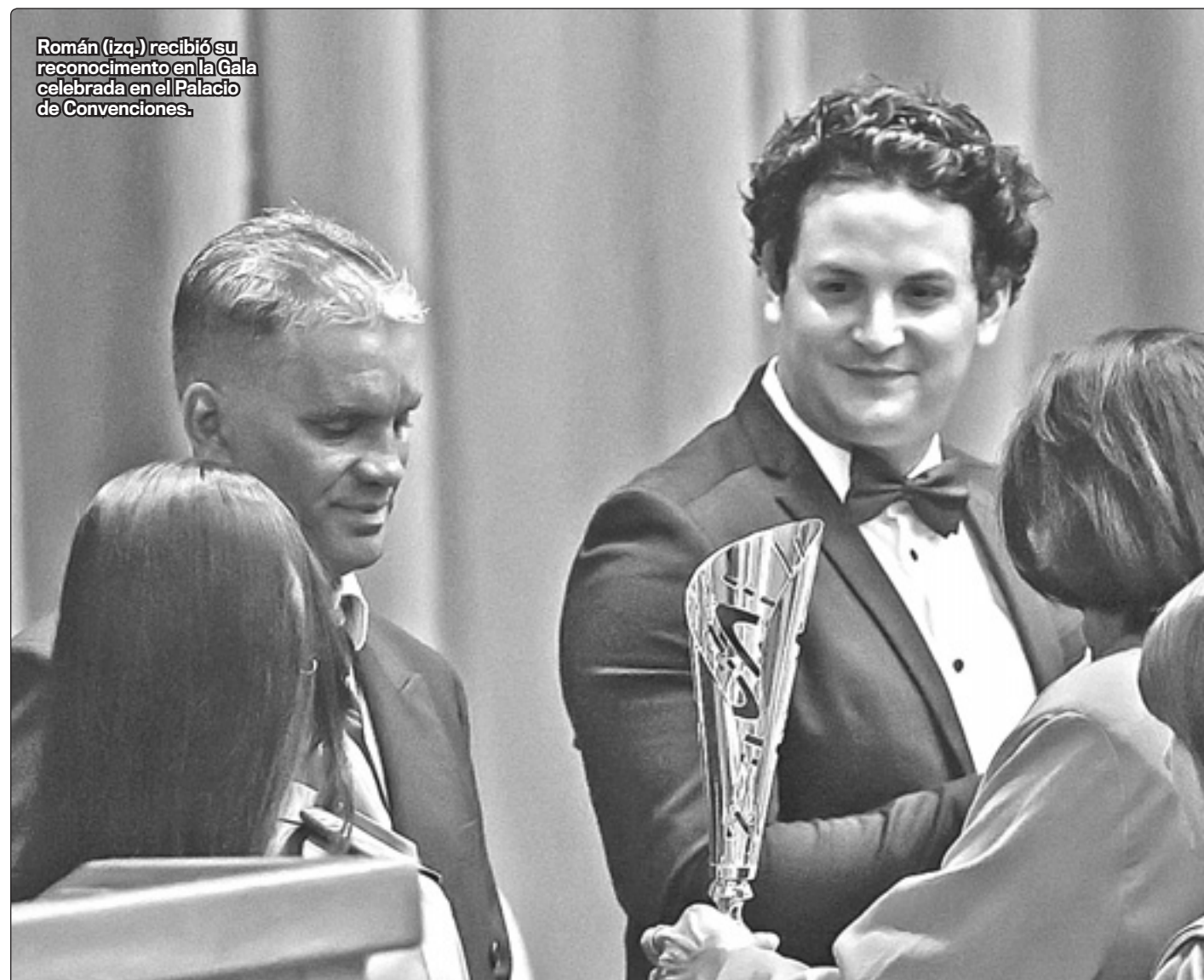
Román (izq.) recibió su reconocimiento en la Gala celebrada en el Palacio de Convenciones.

Palpé muchas veces la sensación de orgullo y satisfacción que sentían sus corazones al compás del himno nacional y con la presea en el pecho. Experimentaban la elevada dignidad que brota cuando se ha librado éticamente la contienda deportiva. ☐